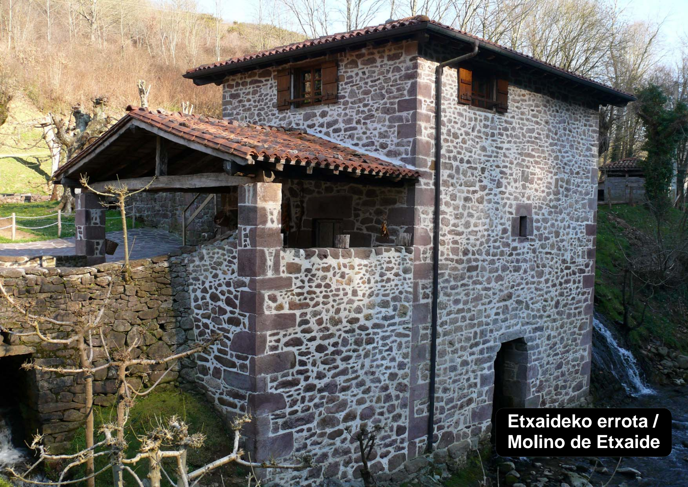
Etxaideko errota / Molino de Etxaide