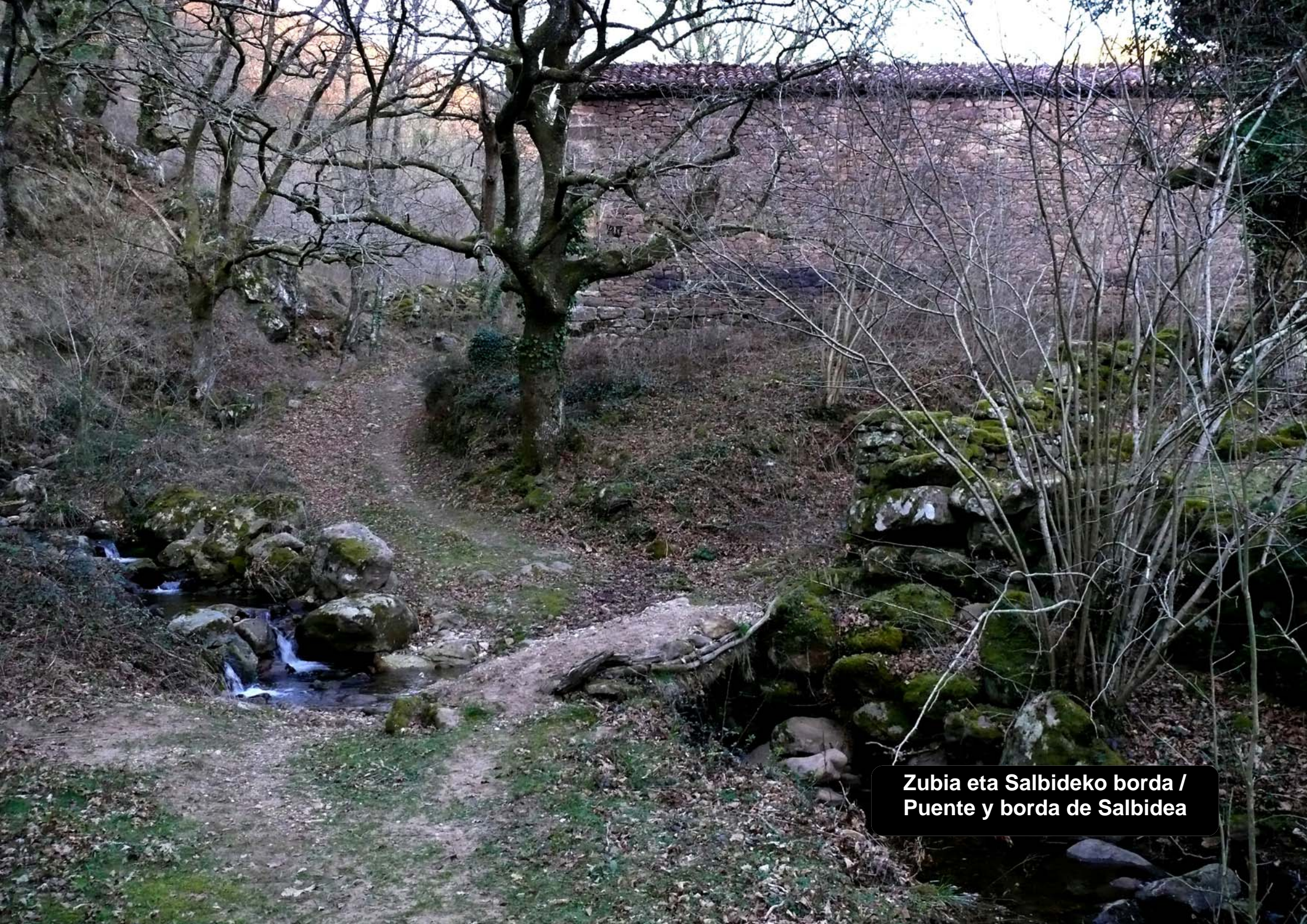
Zubia eta Salbideko borda / Puente y borda de Salbidea