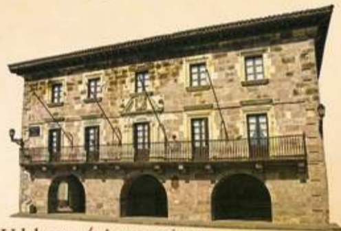
Udaletxea / Ayuntamiento

Herriko Plazaren aurrean Baztango Udaletxea kokatuta dago, Baztan bailara gobernatzen duen Erdi Aroko Batzar Nagusia biltzen den XVII. mendeko eraikina. Eraikinaren izkin batean harri berexi bat dago: euskal pilotaren modalitate zaharrena den laxoan jokatzeko erabiltzen zen botaharria.